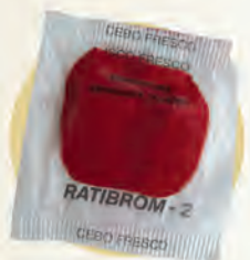
Cebo fresco 10 g

ALTA APETENCIA + TOTAL EFICACIA = CONTROL 100%