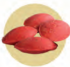
Óvulo 4/5 g