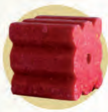
Bloque estriado 20 g