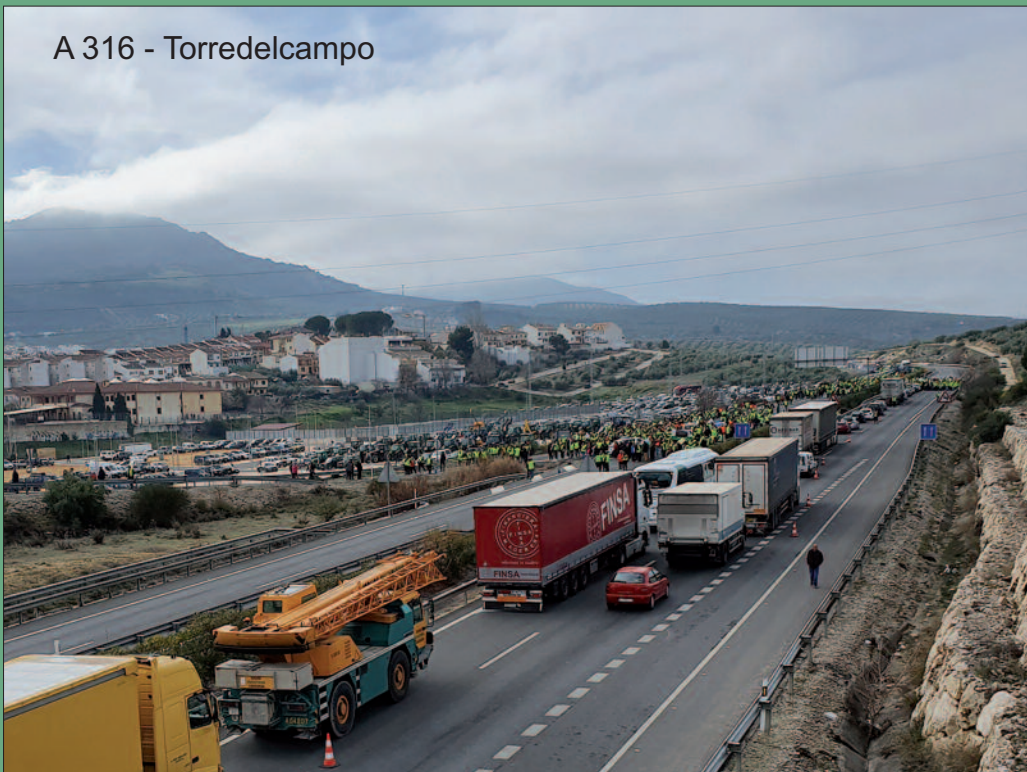
A 316 - Torredelcampo

Llevamos muchas generaciones cuidando de la salud de la población. Luchamos por nuestro presente, mirando atrás a aquellas generaciones que nos han traído hasta aquí con sus esfuerzos. Y ahora pedimos actuaciones valientes para dejar a nuestros hijos un futuro. Si el olivar cae Andalucía se cierra. Más de 300 pueblos en la región dependen del olivar. Nuestra oficina son los 66 millones de olivos que tenemos en esta provincia, que no podemos cerrar, tirar la llave y llevarnos a otro sitio. Hay mimbres para vivir dignamente, para que lo que paga el consumidor sea justo para el produc-