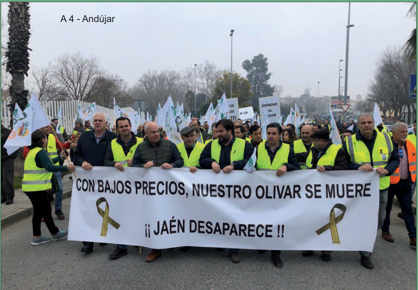
A 4 - Andújar

mana de marzo de 2019 el precio en origen se encontraba en torno a 2,35 euros el kilo, lo que suponía una disminución del 28% respecto al mismo periodo del año anterior. A lo largo de 2019 no sólo no habían subido, a pesar de estar recogiendo una cosecha menor a la anterior, sino que se encontraban aún más bajos. A esto hay que añadir que los márgenes de rentabilidad están muy comprometidos ya que, según diferentes informes