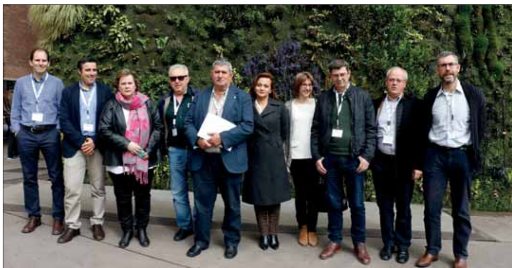
Delegación de UPA en el foro sobre la PAC del futuro.