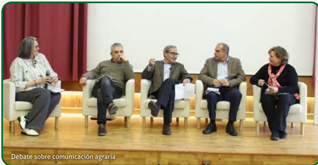
Debate sobre comunicación agraria