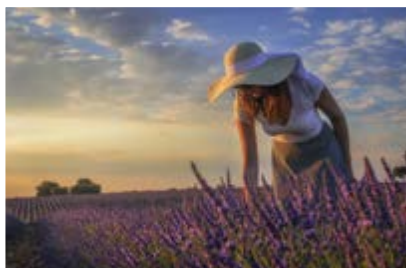
Ana Castellanos Grande Recolectando Aromas Tiedra (Valladolid)