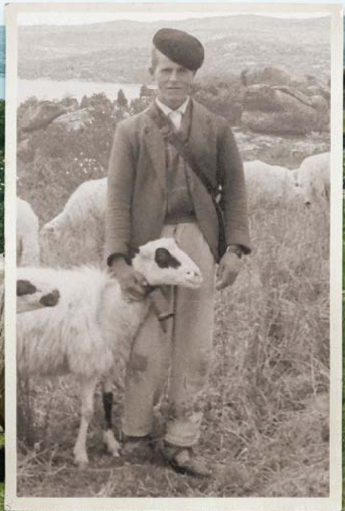
Autor: H. Sanz 1964

El contenido de esta campaña de promoción representa únicamente las opiniones del autor y es de su exclusiva responsabilidad. La Comisión Europea y la Agencia Ejecutiva Europea de Investigación (REA) no aceptan ninguna responsabilidad por el uso que pueda hacerse de la información que contiene.