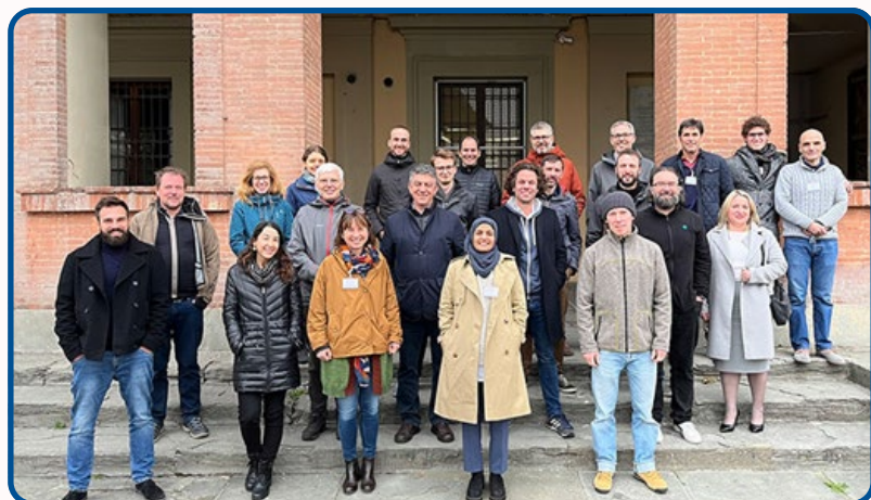
Participantes en el proyecto Leguminose, en el lanzamiento del proyecto, el pasado diciembre, en la Universidad de Florencia.

En España existe una experiencia de intercropping tradicional, como es la mezcla de veza y avena, cuyo destino es el aprovechamiento ganadero. El proyecto 'Leguminose' pretende ampliar el catálogo de asociaciones de cultivos, para que además puedan cultivarse en diferentes zonas, ya sea en secano o en regadío. Sus acciones se realizarán durante los próximos 4 años.