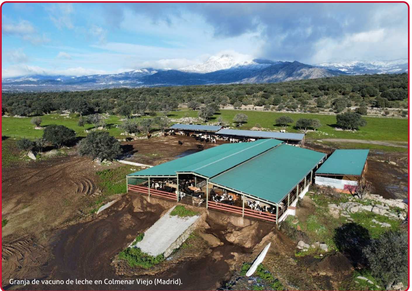
Granja de vacuno de leche en Colmenar Viejo (Madrid).

El nuevo Real Decreto sobre granjas bovinas necesita mejoras. UPA ya negocia nuevos avances