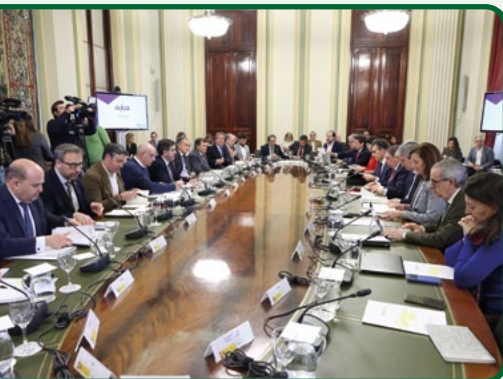
Reunión del Consejo Asesor de la AICA