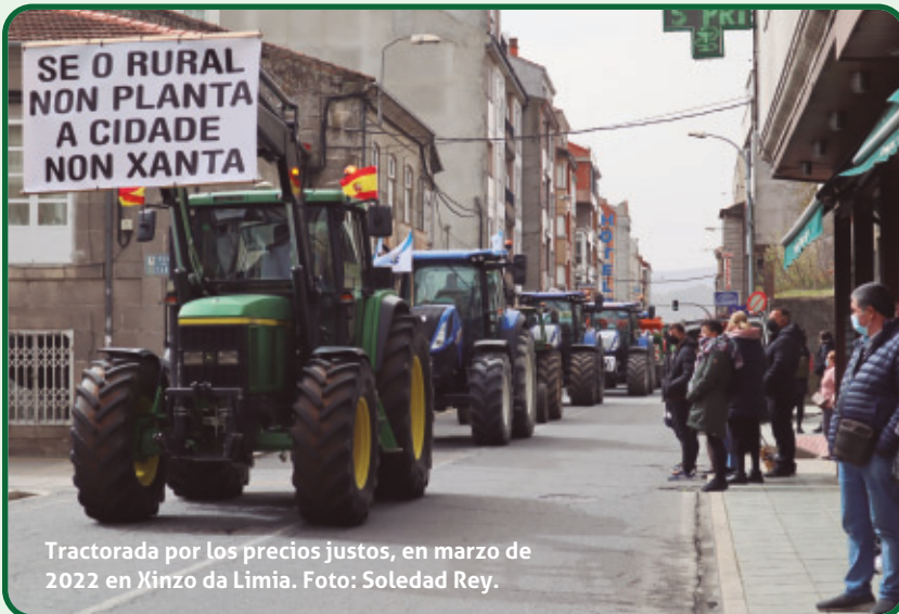
Tractorada por los precios justos, en marzo de 2022 en Xinzo da Limia.

tores de regadío de carácter familiar. Se están fraguando importantes cambios legislativos frente a los que UPA está defendiendo la importancia de un regadío sostenible, que tenga en cuenta criterios sociales, económicos y medioambientales.