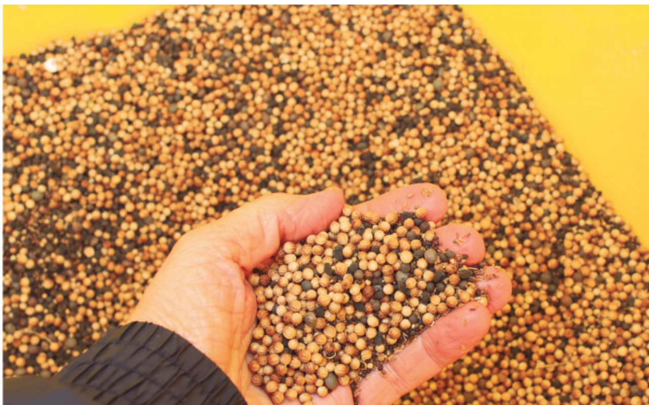
Semillas de especies florales, listas para la siembra en los márgenes multifuncionales.