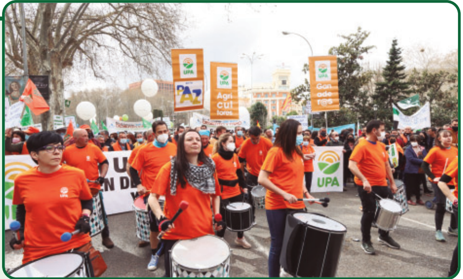
UPA ha llevado las reivindicaciones de la agricultura familiar a multitud de protestas y manifestaciones. Aquí, manifestación el 20 de marzo de 2022 en Madrid.

UPA está trabajando intensamente en los últimos meses para defender a los agricultores de regadío de carácter familiar. Se están fraguando importantes cambios legislativos frente a los que UPA está defendiendo la importancia de un regadío sostenible, que tenga en cuenta criterios sociales, económicos y medioambientales