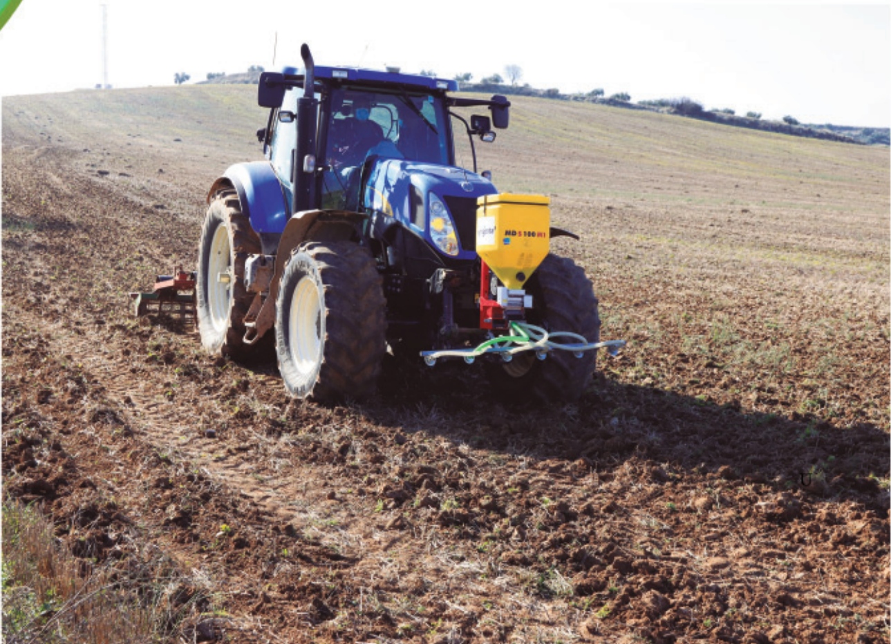
Siembra del margen multifuncional en Santorcaz (Madrid), en diciembre de 2020.