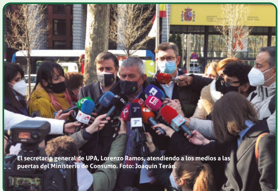
El secretario general de UPA, Lorenzo Ramos, atendiendo a los medios a las puertas del Ministerio de Consumo.

UPA también ha destacado el notable incremento de la ayuda a la contratación de seguros agrarios, de más de un 50% desde 2020. Un logro histórico del sector que se consolida y que hace más accesible esta importante figura para los agricultores y ganaderos de todos los sectores.