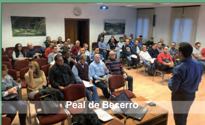
Peal de Becerro