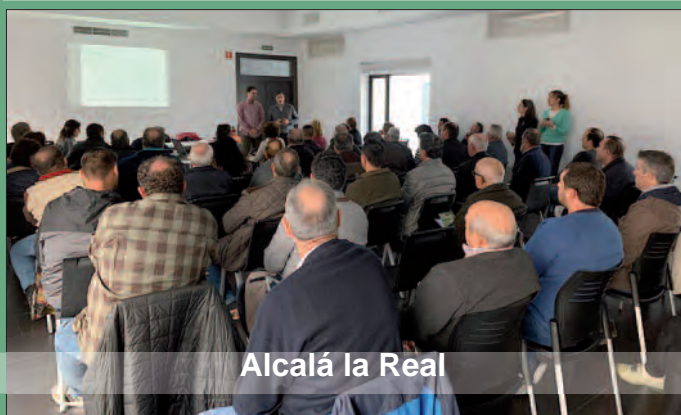
Alcalá la Real