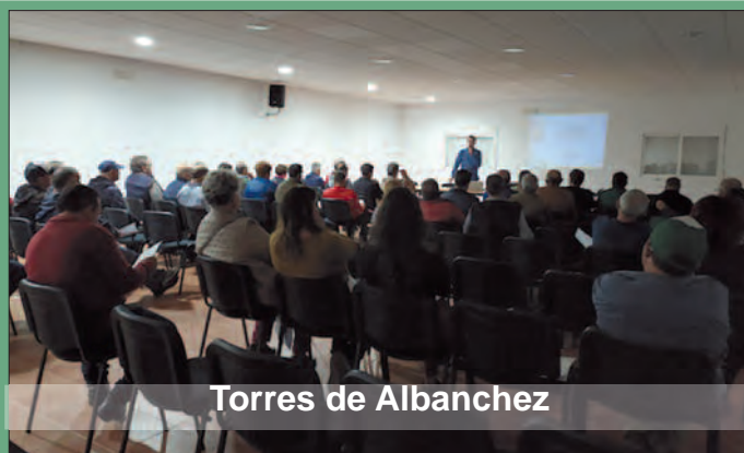
Torres de Albánchez