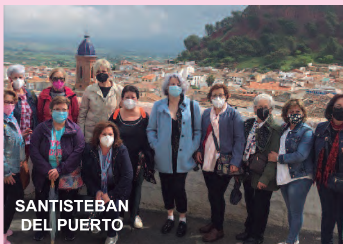
SANTISTEBAN DEL PUERTO