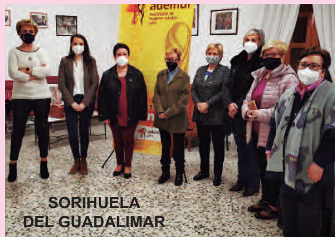
SORIHUELA DEL GUADALIMAR