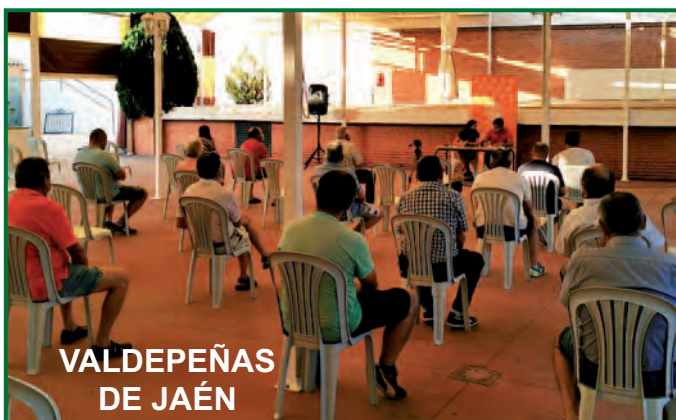
VALDEPEÑAS DE JAÉN