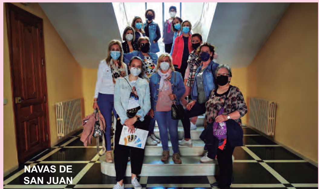
NAVAS DE SAN JUAN

Unas visitas en las que quedó más que evidente que el empoderamiento de la mujer rural, su visibilización y la importancia de su trabajo también guardan mucha relación con el cuidado del entorno y del