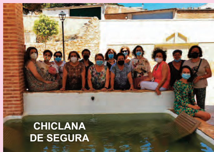
CHICLANA DE SEGURA